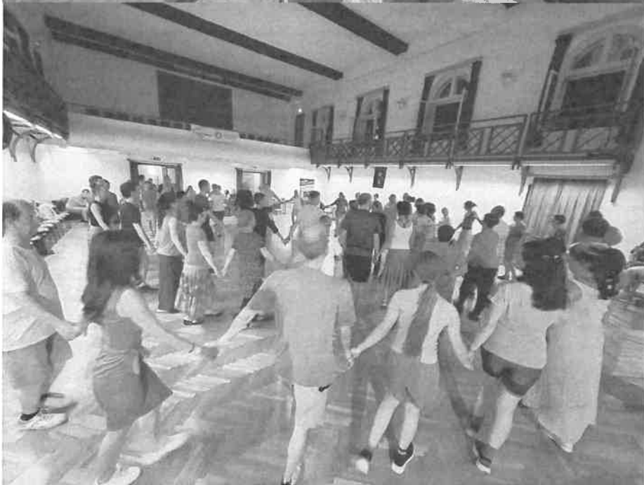
Tábort záró nap: