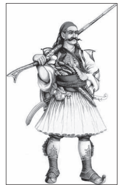
15. kép: 19. századi klefthisz jellegzetes ruhájában és fegyvereivel.

Már az általános iskolában fontos helye volt az önazonosság kialakításának. A 19. század végén a gimnáziumokban a következő megfogalmazással találkozott a diákok: „Az 'egyéb etnikumok', mint pl. a szlávok, albánok, vlachok az évek folyamán már hellenizálódtak, mind szokásaikat, mind többé-kevésbé gondolkodásmódjukat illetően, és most elkezdtek asszimilálódni, görögökké