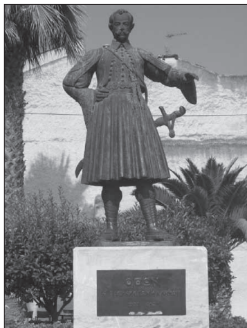
13. kép: Ottó görög király (1833-1862) szobra Napflionban..

Miközben átvették az új ország irányítását, a régenseknek több kérdést is sürgősen rendezni kellett. A felmerülő nehézségek jó része történelmi „örökségként” szakadt a görög államra és annak bajor vezetőire, akik nem minden esetben tudtak megbirkózni a bizánci és oszmán berendezkedés sajátosságaiból eredő problémákkal. Legfontosabb feladataik a közigazgatás megszervezése, az igazságszolgáltatási rendszer megteremtése, a törvények elfogadása, a hadsereg felállítását, a szabadságharcban szolgált katonák letelepítése, az iskolarendszer kiépítése, az egyházi kérdés rendezése és a földbirtokrendszer megreformálása voltak. A helyi közigazgatást a Kapodisztriasz által elkezdett úton hajtották végre: tíz provinciát hoztak létre, amelyeket megyékre osztottak.