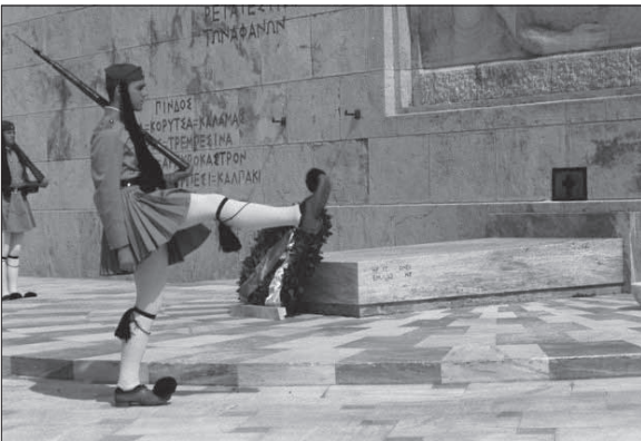
17. kép: Díszőr az ismeretlen katona sírja előtt, a görög parlament épületénél.