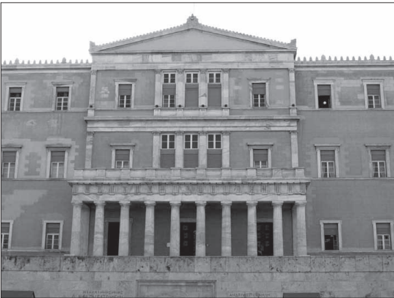
16. kép: A görög parlament épülete